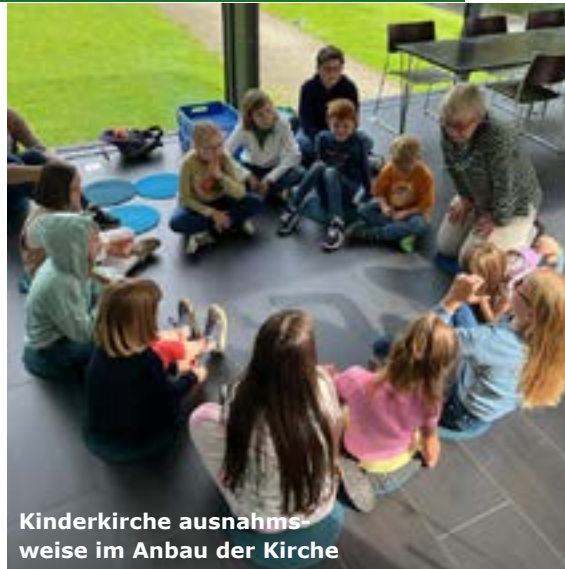
Kinderkirche ausnahmsweise im Anbau der Kirche

Gemeinsam mit den Erwachsenen haben sie dann das Abendmahl festlich in der Kirche gefeiert.