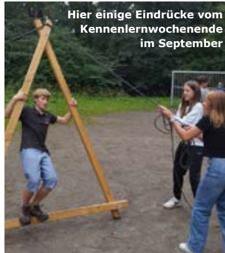
Hier einige Eindrücke vom Kennenlernwochenende im September

Das Konfi-Team war in diesen Phasen in der Beobachterrolle und konnte viele gute Eindrücke mitnehmen. Danach spielten seither Themen wie Gemeinde, Gottesdienst, Bibel, persönliche Zugänge zu Gott eine Rolle. Einiges von dem, was die Jugendlichen bewegt, wird sich auch diesmal wieder (im neuen Jahr) in von ihnen selbst gestalteten Gottesdiensten wiederfinden.