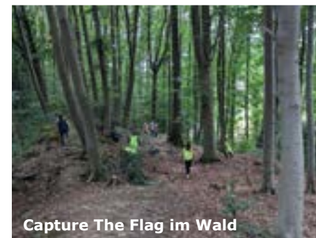
Capture The Flag im Wald