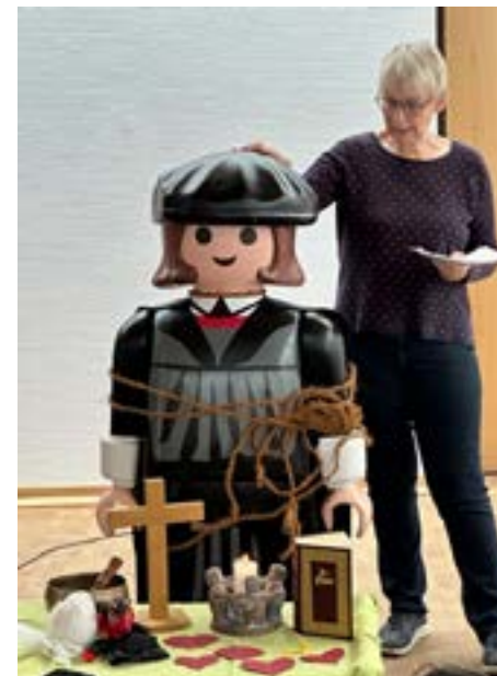
„Luther und Halloween“ war das Motto der Kinderkirche im Oktober

spiel werden verteilt und die Proben beginnen am Freitag, den 17.11.2023 um 17 Uhr!!! Wer als Schauspieler oder Sänger am 3. Advent und Heiligabend dabei sein will, ist dann wieder herzlich eingeladen!