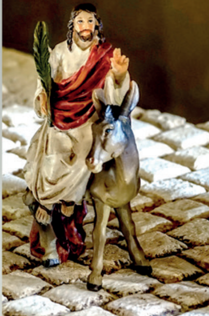
Einzug in Jerusalem am Passahfest

KiBo=Kirche Bommern, GhBo=Gemeindehaus Bommern KiWe=Kirche Wengern