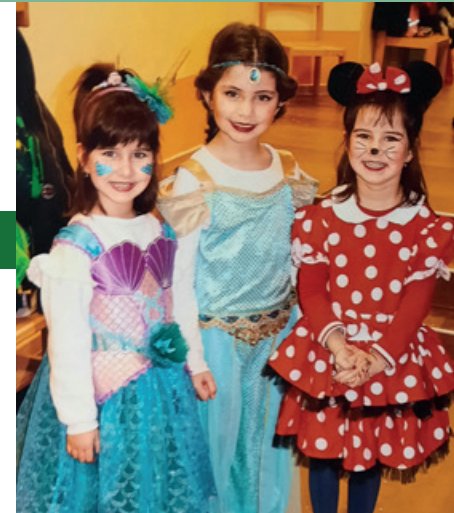
Karneval bei den „Kleinen Freunden“

hits. Tanzspiele wie Luftballontanz oder die bekannte „Reise nach Jerusalem“ waren hier bei den Kindern besonders beliebt. Auch hier hatten die Kinder ihre „ruhige“ Zeit beim Buffet und staunten nicht schlecht bei der Kostümvorstellung, als zum Beispiel der Astronaut gemeinsam mit der Hexe Petronella Apfelmus durch den Gruppenraum flog.